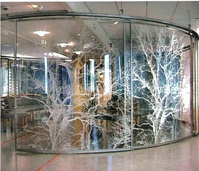
Galina Manikova, © BONO/Galina Manikova 2006

Når den kjente, amerikanske fotoskribenten Lyle Rexer skriver om Galina Manikova, tyr han til den gamle definisjonen fra fotografiets barndom, av Henry Fox Talbot: "Fotografi er den realiserte magien".